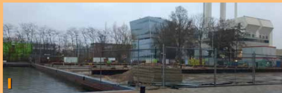
Foto I toont u de voorbereidende werkzaamheden vanaf de Nieuwe Haven richting de Rotterdamseweg.