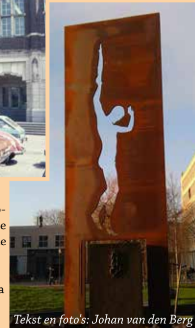
Tekst en foto's: Johan van den Berg