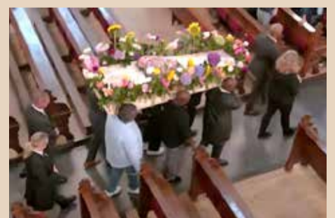
(De familie heeft toestemming gegeven voor het plaatsen van de foto.)

ten van de hele dag worden. Kortom: deze familie heeft me eraan herinnerd waarom ik dit werk doe. Om mensen te helpen op hún manier afscheid te nemen — met liefde, aandacht en vertrouwen.