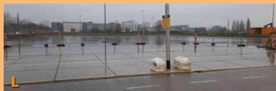
Foto L toont u een van de aangelegde parkeerplaatsen welke voornamelijk gebruikt gaan worden voor de activiteiten van het nieuwe theater.