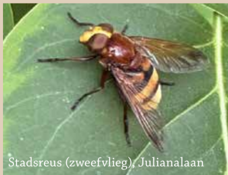
Stadsreus (zweefvlieg), Julianalaan

Op allerlei plekken in de wijk wordt de natuur een handje geholpen, van een paddentunnel onder de Mijnbouwstraat tot een wilde bijenbiotoop langs de Jan de Oudelaan. Een goed voorbeeld van het creëren van meer natuur is het Mekelpark op de TU campus. Daar is afgelopen jaren het steriele gazon deels vervangen door meer natuurlijke begroeiing en zijn plekken aangelegd voor