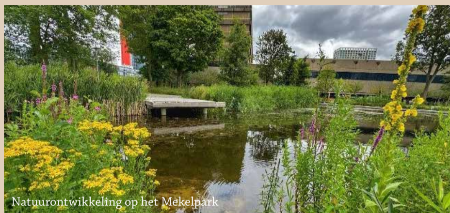
Natuurontwikkeling op het Mekelpark