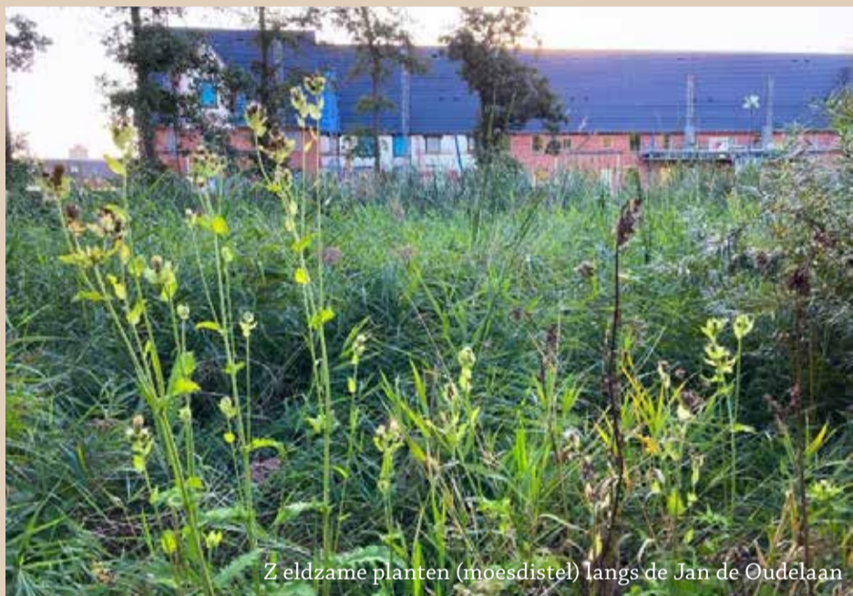
Zeldzame planten (moesdistel) langs de Jan de Oudelaan

Niet ieder groen wordt evenveel gewaardeerd. In het verleden is soms meer ruimte gegeven aan natuur waar eerst strakke gazons waren, denk aan de Koningin Emmalaan. Daar kwamen boze reacties op omdat men geen wildgroei van brandnetels wil. Wél hier en daar wat inheemse bloemen, geen massa brandnetels, riet en braamstruiken. De gemeente wil meer groen en natuur in de stad en ook bewoners kunnen hieraan bijdragen.