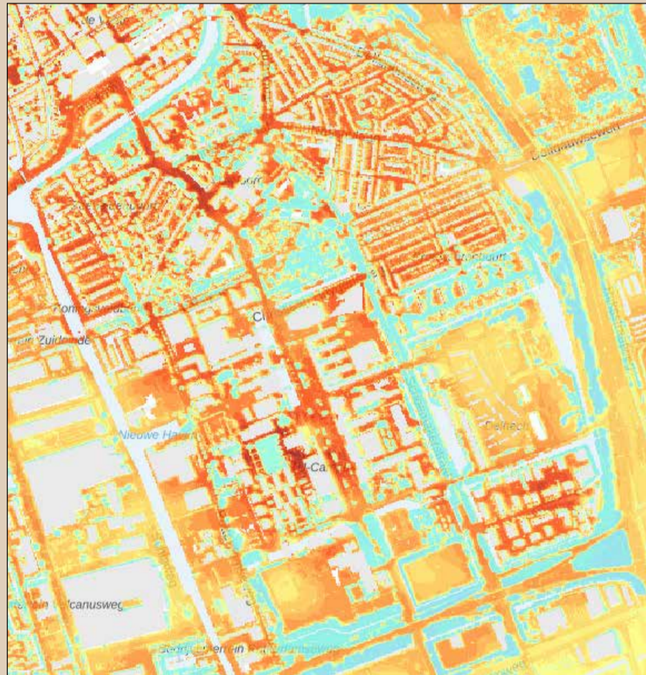
Hittekaart - gevoelstemperatuur op een zomerse dag. Wippolder.

Wie de hittekaart van Delft bekijkt (in de "Atlas natuurlijk kapitaal" op internet) ziet het centrum van Delft donkerrood kleuren. Een hitte-eiland. Ook delen van de Wippolder kleuren donkerrood, vooral de Zeeheldenbuurt. Hoe meer groen, om de stad, maar bijvoorbeeld ook de begraafplaats Jaffa, hoe lager de temperatuur. Interessant daarbij is dat het westelijke deel (buurten Zeeheldenbuurt en TU Noord) veel bomen heeft die schaduw geven, terwijl de oostelijke Wippolder (buurten Wippolder-Noord en (deels) Wippolder-Zuid) minder bomen heeft, maar dichterbij grote groengebieden ligt en gemiddeld minder warm is.