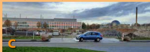
Foto C toont u de opslag van grondmateriaal en stenen op een terrein wat mogelijk een bestemming heeft gekregen, maar waar nog niet staat aangegeven wat daar gaat komen.