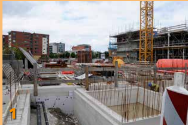
Foto 1-2: Aan de Ireneboulevard krijgt de bouw van een nieuwbouwcomplex gestalte. In het complex zijn 118 zorgstudio's en 67 sociale huurwoningen opgenomen, het betreft een gezamenlijk project van zorgorganisatie Pieter van Foreest en woningcorporatie Woonbron.