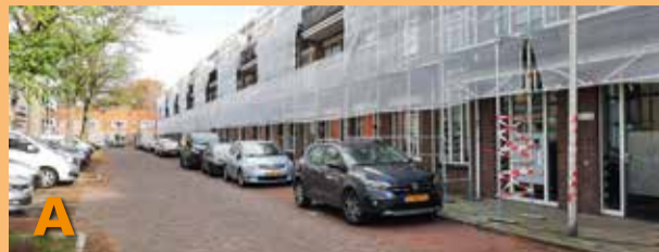
Foto A laat u zien dat een groot deel van de nieuwbouw in deze straat ingepakt staat, ook een deel in de Prof. Bosschastraat. De reden is dat er gewerkt wordt aan die delen van de woningen die een likje verf nodig hebben.