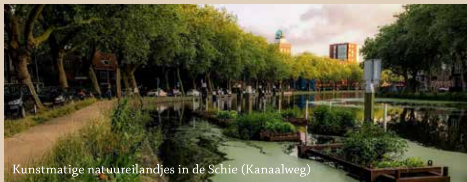
Kunstmatige natuureilandjes in de Schie (Kanaalweg)

wilde bijen. Ook op andere plekken is natuur of natuurlijke waterberging aangelegd zoals natuurvriendelijke oevers bij de Prins Bernhardlaan en wadi's (wateropvang) bij het Zuidplantsoen.