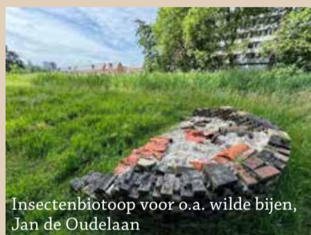
Insectenbiotoop voor o.a. wilde bijen, Jan de Oudelaan

wilde bijen. Ook op andere plekken is natuur of natuurlijke waterberging aangelegd zoals natuurvriendelijke oevers bij de Prins Bernhardlaan en wadi's (wateropvang) bij het Zuidplantsoen.