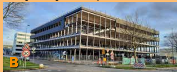
Foto B laat u zien: de vordering van de uitbreiding van het nieuwe complex van Next. Vergeleken met drie maanden geleden is er bijna een compleet gebouw op de grond gezet. De planning is dat het in het 3e kwartaal van 2025 operationeel is. Maar als alles zo vlot gaat als dit, dan zou dat wel eens eerder kunnen zijn.