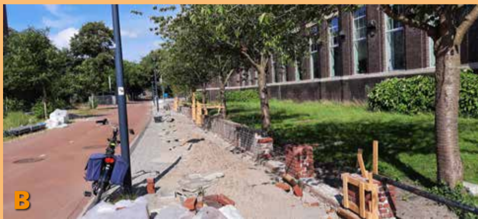
Foto B laat u zien dat rondom het gebouw Julianalaan 134 de afscheidingsmuur tussen de stoep en het plantsoen hersteld wordt.