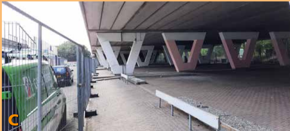
Foto C laat u zien dat alles wat te maken had met een grote showroom van de Skoda-dealer in het verleden en wat later een verzamelplek was voor alternatieve bewoning, is vrij gemaakt en in de oorspronkelijke staat is gebracht.