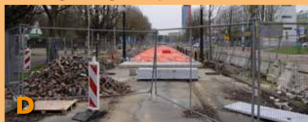
Foto D laat u zien: de vorderingen van de werkzaamheden voor de aanleg van tramlijn 19. Dit is de tramlijn die meer euro's kost dan velen van u zullen schatten. De planning is nu weer bijgesteld naar collegejaar 2025/2026.