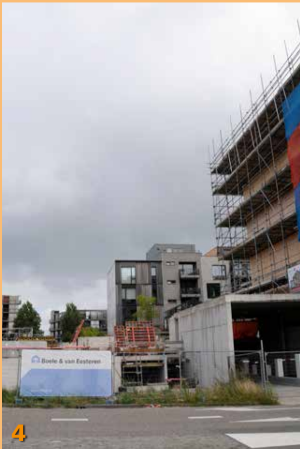
Foto 5: Direct grenzend aan beide projecten wordt ook de laatste hand gelegd aan de individuele panden die hier worden gebouwd.

ken in houtskeletbouw in opdracht van Achmea en ontworpen door architectenburo Inbo.