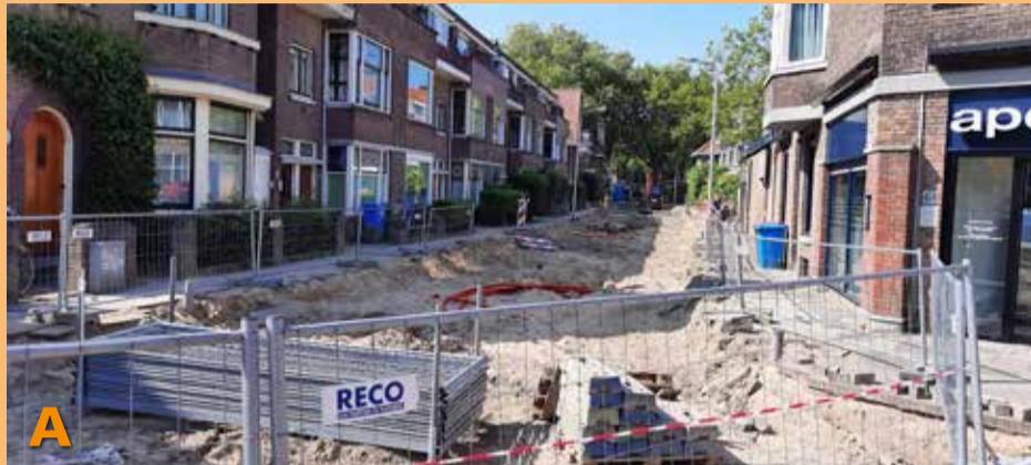
Foto A: Nadat de Kanaalweg lange tijd was afgesloten vanwege onderhoudswerkzaamheden is nu de Botaniestraat aan de beurt voor noodzakelijke vervangingen. Hierdoor is de doorgang naar de draaibrug alleen over de stoep te gebruiken.