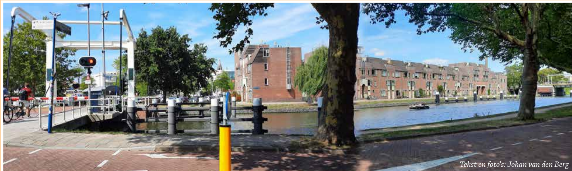
Tekst en foto's: Johan van den Berg