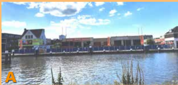
Foto A laat u zien vanaf het Proosdijpad: het Zuideinde tussen de Abtswoudseweg en het pand van Bo-Rent. Er staan nu schermen om het terrein van Bo-Rent. Deze gehele hoek gaat worden gesloopt voor nieuwbouw.