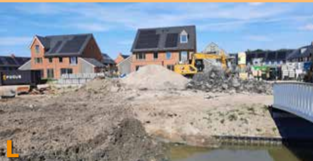
Foto L t/m U laten u in willekeurige volgorde zien: de bouwwerkzaamheden die de voltooiing moeten worden van de jarenlange periode van bouwen daar.