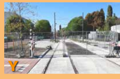
Foto IJ en Z laten u zien: de vorderingen van de aanleg van tramlijn 19. Zal het lukken dat de tramlijn 19 in juni 2026 gaat rijden?