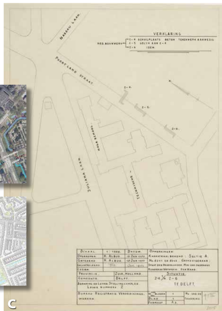
Tekst en foto's: Johan van den Berg.