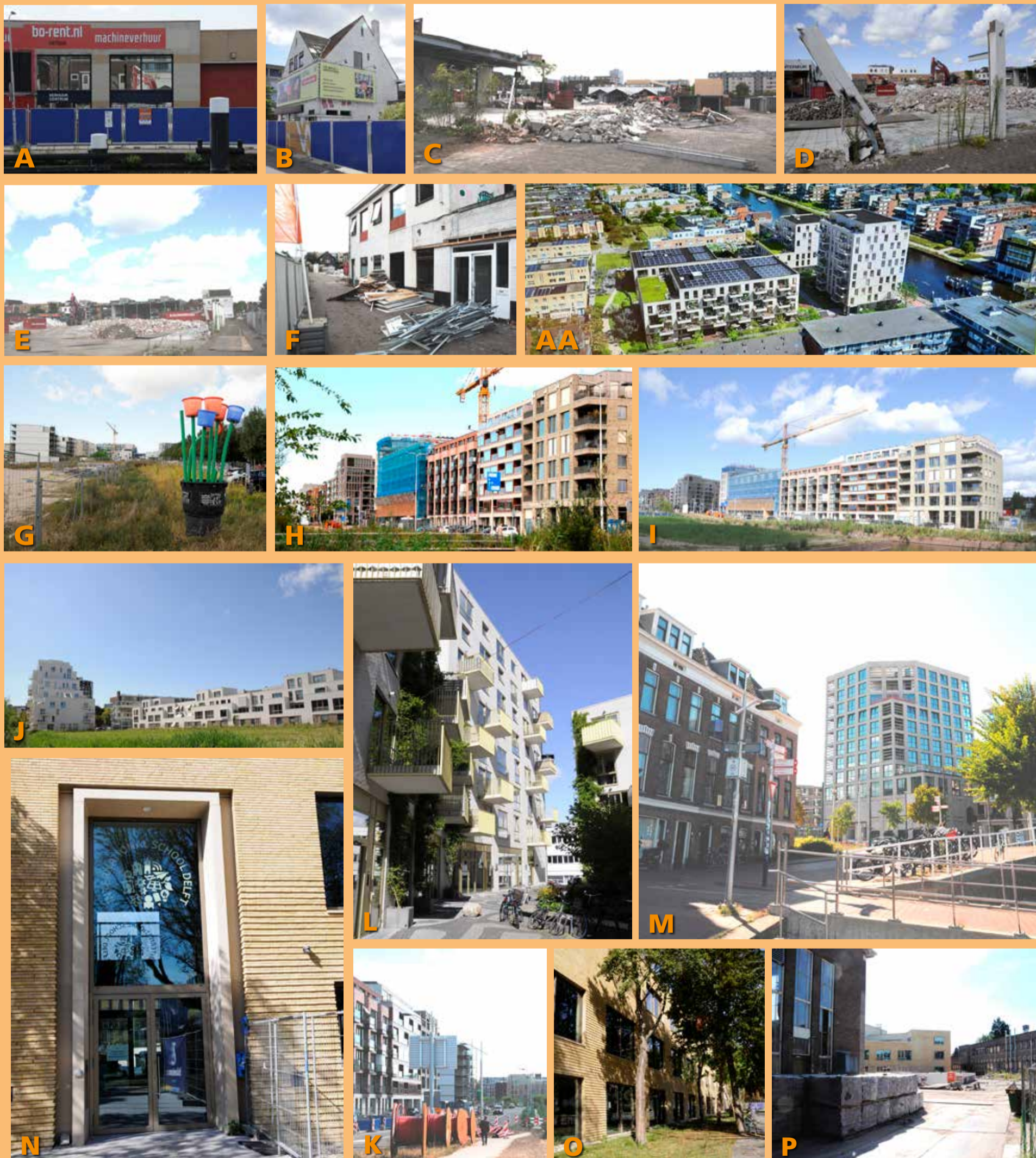
Foto P laat u zien op het bouwterrein achter het voormalige gebouw van Scheikunde aan de Julianalaan.

Foto O laat u zien de ingang van de Internationale school aan de Prins Bernhardlaan.