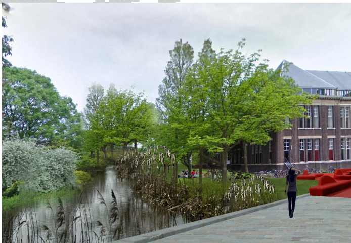
Impressie bij Luz architecten

Uw mening: Op de Pauwmolen wordt een 17 etages (55 m) hoog gebouw gepland. De Pauwmolen ligt pal naast de A13.