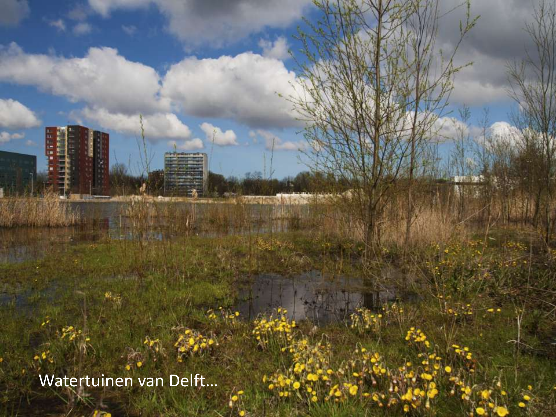
Watertuinen van Delft...