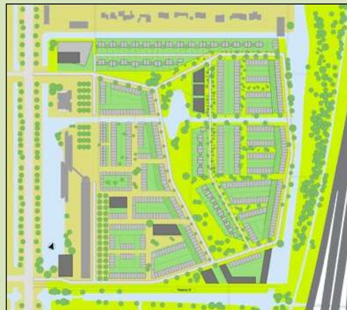
Watertuinen van Delft